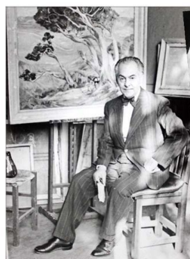
Carlos Isamitt también desarrolló una amplia historia en la pintura, como lo muestra su archivo familiar.