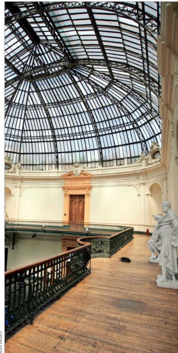
El 95% de los museos del mundo continúa cerrado y la pregunta es cuándo y cómo retomarán los públicos esos espacios. Aquí, el Museo de Bellas Artes.