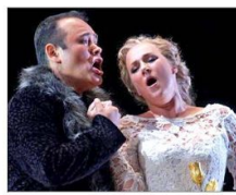
Javier Camarena y Diana Damrau.

La última creación de Bellini, "Los puritanos", se podrá ver gratis desde hoy (20:00 horas) y hasta el 26 de junio, a través de la plataforma Municipal Delivery. Se trata de una elogiada producción del Teatro Real de Madrid, con un reparto que incluye, entre otras voces, al tenor Javier Camarena y la soprano Diana Damrau. La régie es de Emilio Sagi. El montaje se emitirá gracias a un convenio entre el teatro de Agustinas y el coliseo madrileño. Más información en Municipal.cl