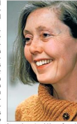
La autora también es favorita para el Nobel de Literatura.

La entrega de los premios Princesa de Asturias se prevé para el próximo 16 de octubre, en Oviedo, en una ceremonia presidida por los reyes.