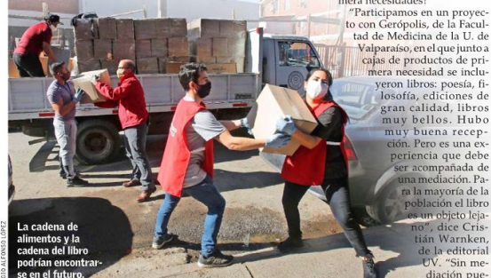
La cadena de alimentos y la cadena del libro podrían encontrarse en el futuro.