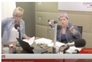
VIDEO | "Saco de...": el análisis internacional de Patricia Maldonado por asunción de Maduro