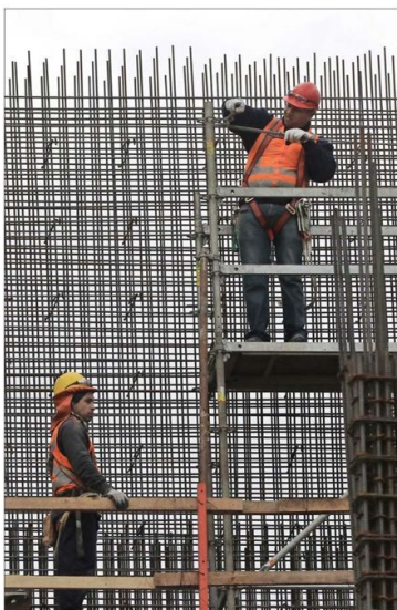
El informe del proyecto de ley del Gobierno prevé un efecto global a mediano plazo de 442.762 empleos que se desarrollarán de manera formal.

En los nuevos puestos creados, 79 mil serían ocupados por actuales desempleados y 159 mil por personas inactivas, es decir, fuera de la fuerza laboral. Además de los servidores de aplicaciones digitales, la iniciativa ayudaría a formalizar a 110 mil actuales empleados informales.