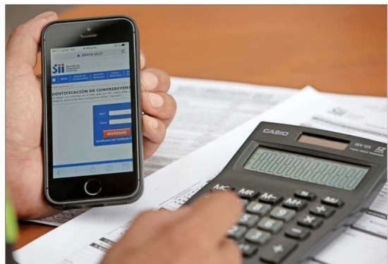
La reforma que obligaba a los independientes a cotizar estuvo por años en espera de que empezara su aplicación, lo que ocurrió en la Operación Renta de abril de este año.

sones?", cuestionó Cifuentes. En esa línea, aseguró que las AFP no contribuyeron a la educación previsional, pero no las responsables de las bajas pensiones. "La principal razón de que la gente no cotice y de que haya bajas pensiones no es porque el sistema esté mal, sino porque no se hicieron los ajustes paramétricos cuando correspondía", manifestó la experta. Asimismo, señaló que es "tremendamente necesario" que las personas ahora estén obligadas a cotizar con la ley de independientes, pese al rechazo que hay en el sistema. Más independientes A principios de año se aprobó la ley que obliga a cotizar a los trabajadores independientes que emiten boletas de honorarios. A través de las retenciones de impuestos por las boletas emitidas en 2018 se dará cobertura en seguridad social. Es decir, en los seguros de invalidez y sobrevivencia, seguro de accidentes de trabajo, Ley Sanna, salud y ahorro para pensiones.